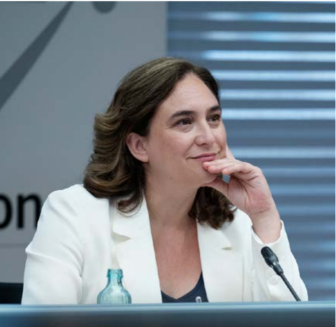
Ada Colau, alcaldessa de Barcelona

Si veníem d’un mercat laboral marcat per la temporalitat i la precarietat herència de la Nova Reforma Laboral del PP, la Nova Reforma Laboral liderada per Yolanda Díaz és un primer pas en la direcció d’un mercat laboral on l’estabilitat i la contractació indefinida i de qualitat sigui la norma i no l’excepció. De fet, en el primer mes de vigència d’aquesta reforma, la contractació indefinida ha augmentat a Barcelona (+76,3 %) , a Catalunya (+78,4 %) i a Espanya (+92,2 %) , en relació amb el gener de 2021.